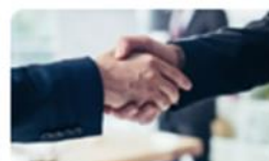
Resolver os conflitos de consumo 22 set. | 14h30-17h30