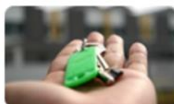
Lar doce lar: o arrendamento 08 set. | 14h30-17h30