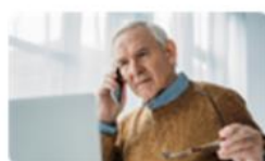
Dizer não! Contratos abusivos e vendas agressivas 09 jun. | 9h30-12h30