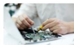
Garantia e reparação dos produtos 16 jun. | 14h30-17h30