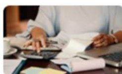
Contas Certas: Serviços bancários e financeiros 02 jun. | 9h30-12h30