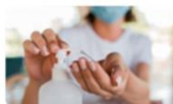
A Saúde a que tem direito 15 set. | 14h30-17h30