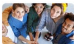
A Formação e os Direitos dos Consumidores Migrantes 19 mai. | 14h30-17h30