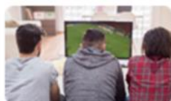
Os Serviços Públicos Essenciais: telecomunicações 23 jun. | 14h30-17h30