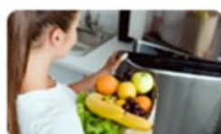
Comer bem é mais barato 27 mai. | 14h30-17h30