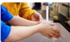
Os Serviços Públicos Essenciais: energia e água 30 jun. | 14h30-17h30